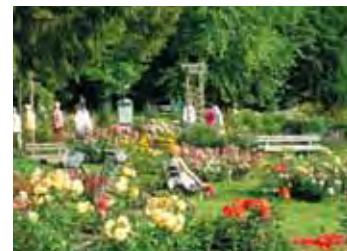
Bad Wörishofen, Kurpark