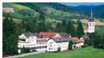
MORADA Hotel Nordrach

Interessante Ausflüge sind vor Ort buchbar.