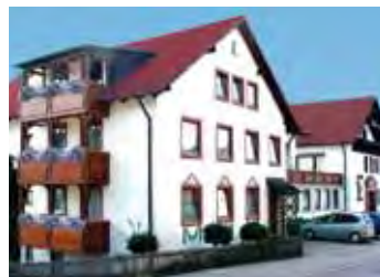
MORADA Hotel Bad Wörishofen

Es befindet sich nur wenige Schritte vom Zentrum und der Fußgängerzone entfernt. Aufzüge führen in die insgesamt 4 Etagen des Hauses. Die Zimmer sind mit Bad bzw. Dusche und WC, Telefon, Fernseher und größtenteils Safe und Balkon ausgestattet. Restaurant, „Sonnenstüble“ und bei schönem Wetter auch die Terrasse zählen zu den gastronomischen, Sauna, Kneipp'sches Tretbecken und der klassisch eingerichtete Ruheraum zu den entspannenden Einrichtungen.