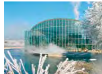
Therme Bad Wörishofen