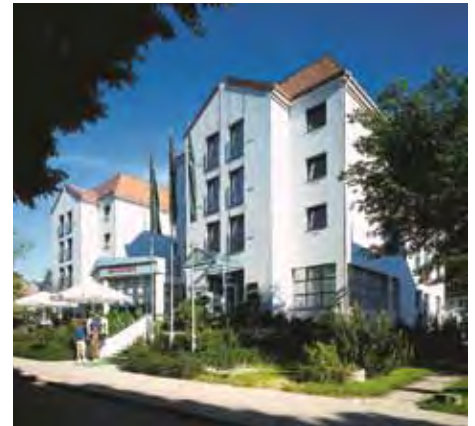
MORADA Hotel Arendsee

Das dreistöckige Hotel in unmittelbarer Nähe von Stadtwald, Promenade, feinsandigem Strand und Meer, beherbergt nur 66 Doppel- und Zweibettzimmer, was eine familiäre Atmosphäre begünstigt. Sie sind mit Dusche, WC und Fön, Fernseher, Radio und Telefon ausgestattet. Ein Aufzug befördert die Gäste in die jeweiligen Etagen. Architektonisch interessant präsentiert sich das Restaurant mit vorgelagerter Terrasse, von dem aus Sie freien Blick auf die Ostseeallee genießen. Im separaten Raum bedienen Sie sich am Buffet und im Foyer mit der Rezeption, einer kleinen Bar und Sitzgruppen läßt es sich angenehm plaudern. Von hier aus gelangen Sie ins Souterrain zu Sauna und Solarium.