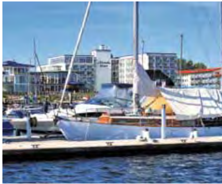
MORADA Resort Kühlungsborn