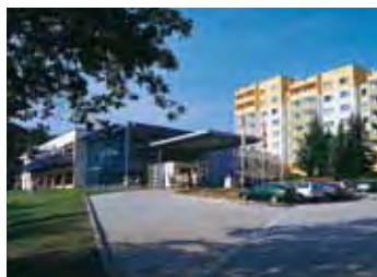
MORADA Hotel Alexisbad

Interessante Ausflüge sind vor Ort buchbar.