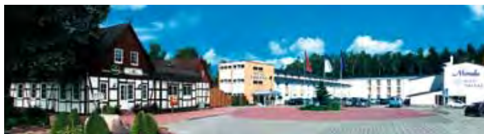
MORADA Hotel Isetal

am idyllischen Lauf der Ise, verfügt über zwei Zimmerkategorien: Komfort-Zimmer mit Dusche, WC und Fön, separat stellbaren Betten, Flachbildfernseher und Telefon (eine Unterbringung in der nur fünfzig Meter vom Hotelgebäude entfernten Dependence ist möglich) und Ambiente-Zimmer mit Duschwanne (Haltegriff), WC, Fön, Kosmetikspiegel und Handtuchheizung, Flachbild-LCD-Fernseher, Telefon, Bademantel, zweitem Kopfkissen und Safe. Aufzüge, Speisräume/Restaurants, Bar, Panorama-Hallenbad und Sauna zählen zu den weiteren Einrichtungen.