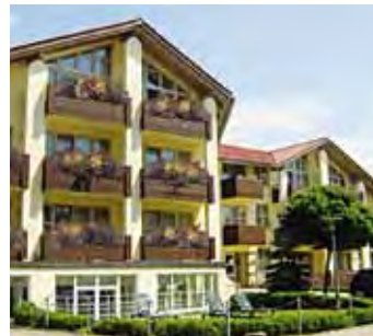
MORADA Hotel Bodenmais

Interessante Ausflüge sind vor Ort buchbar.