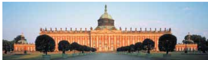
Potsdam, Sanssouci, Neues Palais

Interessante Ausflüge sind zudem vor Ort buchbar.