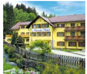
MORADA Hotel Bischofsmais