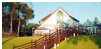
MORADA Hotel Am Mellensee

Seine Zimmer verteilen sich ab dem Erdgeschoß auf drei Etagen und sind mit Dusche, WC, Fön und Handtuchheizung, Fernseher und Telefon ausgestattet. Eine sehr schöne Sicht auf den See genießen Sie vom neuen Wintergarten aus.