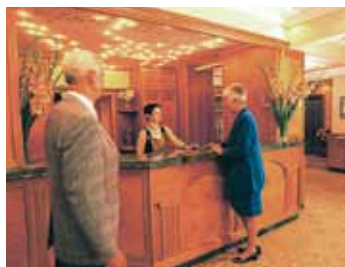
MORADA Kurhotel Unter den Linden, Rezeption

mit eigenem Thermal-Mineralbewegungsbad , das direkt aus der Füssinger Ursprungsquelle gespeist wird. Weitere Einrichtungen des Hauses sind Dampfbad, Sauna, Infrarotkabine, ein stilvolles Restaurant, Kaminzimmer, Aufzüge, Einzel-, Zweibettzimmer und Junior-Suiten mit Dusche, WC, Kosmetikspiegel, Fön, Fernseher und Telefon.