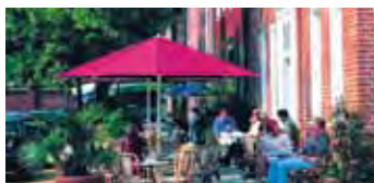
Potsdam, Holländisches Viertel