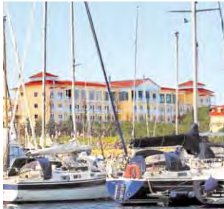
MORADA Strandhotel Ostseebad Kühlungsborn

Interessante Ausflüge sind vor Ort buchbar.