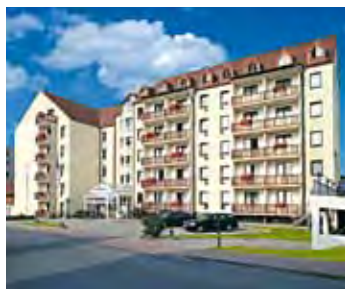
MORADA Hotel Gothaer Hof

Ein freundlich gestalteter Eingangsbereich mit Rezeption und kleiner Bar, Lift, Zimmer mit Dusche und WC, Fön, Kosmetikspiegel, Badhocker, Fernseher, Uhrenradio und Direktwahltelefon, Restaurant mit kleiner Terrasse, Hallenbad und Sauna erwarten Sie hier.