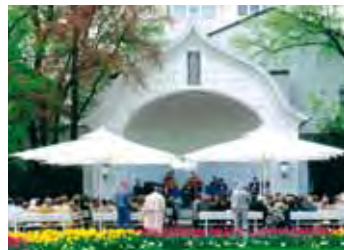
Bad Wörishofen, Musik-Pavillon