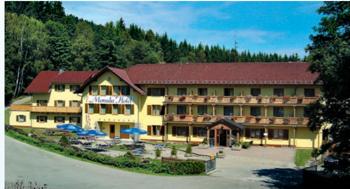
MORADA Hotel Bischofsmais

... mit „All inclusive-Angebot“! ... mit großem Wellness- & Freizeitbereich!