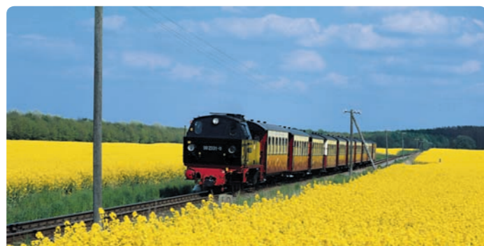
Kühlungsborn, Dampfeisenbahn „Molli“

Im MORADA Resort Kühlungsborn begrüßen Sie nach dem Abendessen Ihr SKAN-CLUB 60 plus-Team und die Hoteldirektion mit einem Willkommenscocktail. Sie erfahren mehr über das Programm Ihres Aufenthaltes und können sich anschließend mittels eines Diavortrages auf Ihre Urlaubsregion bereits einstellen lassen.