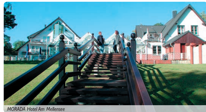
MORADA Hotel Am Mellensee

Wo gibt es das sonst noch: eben erst die Weltstadt Berlin gesehen – und schon die Beine im kühlenden See bei untergehender Sonne baumeln lassen... eben erst mit einem Kahn durch den Spreewald gestakt – und schon beim Durst löschenden Alsterwasser oder Radler auf der Terrasse sitzen und Schwäne beobachten? Das gibt es nur während unserer 8-Tage-Seniorenreise in den Süden unserer Hauptstadt Berlin , an den Mellensee und in das