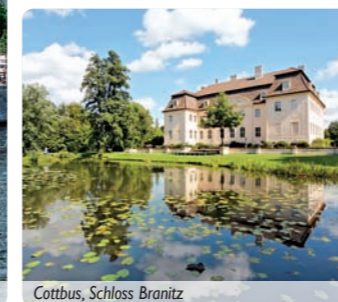
Cottbus, Schloss Branitz