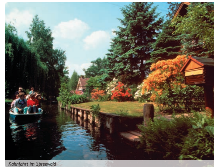
Kahnfahrt im Spreewald

Schöne und vor allem erlebnisreiche Tage neigen sich ihrem Ende entgegen. Heute verabschieden Sie sich vom Mellensee und fahren nach Hause.