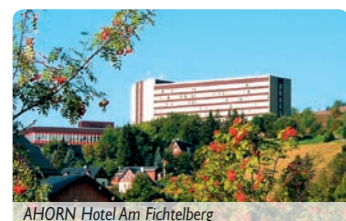
AHORN Hotel Am Fichtelberg

Vier Aufzüge führen bis zur obersten, der 7. Etage des Hauses. Die Zimmer sind mit Dusche, WC und Fön, Fernseher, Radio und Telefon ausgestattet. Zu den gastronomischen Einrichtungen zählen das Restaurant Oberwiesenthal, Restaurant Keilbergblick, Steakrestaurant AZado, die Hallenbar, Knappenstube und vom Erzgebirgsrestaurant „Pistenblick“ genießen Sie den schönsten Blick auf Oberwiesenthal. In der Hotelhalle finden Sie auch einen Hotelshop. Der Wellnessbereich besteht aus der Saunalandschaft (Finnische und Biosauna), einem umfangreichen Massageangebot (klassisch, Ayurveda, Klangschalentherapie) und dem Hallenbad, das mit dem Hotelgebäude mittels eines Überganges verbunden ist. Unsere SKAN-CLUB 60 plus-Betreuung und das Team des Hotels freuen sich auf Ihren Besuch!