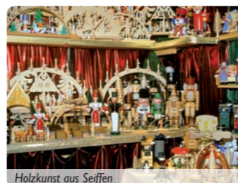
Holzkunst aus Seiffen