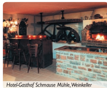
Hotel-Gasthof Schmause Mühle, Weinkeller