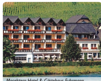
Moselstern-Hotel & Gästehaus Fuhrmann

Tips und Hinweise zu Ihrem Urlaubsziel gibt Ihnen unser SKAN-CLUB 60 plus-Betreuer gern.