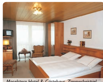
Moselstern-Hotel & Gästehaus, Zimmerbeispiel