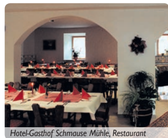
Hotel-Gasthof Schmause Mühle, Restaurant