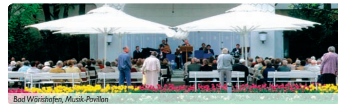
Bad Wörishofen, Musik-Pavillon

Heute fahren Sie leider schon wieder nach Hause.