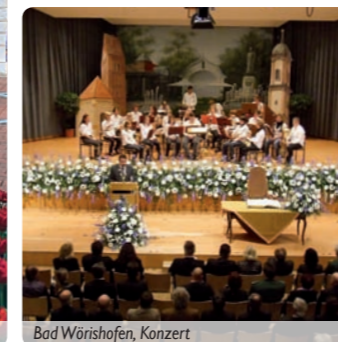
Bad Wörishofen, Konzert