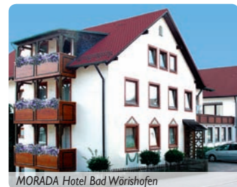
MORADA Hotel Bad Wörishofen

Von hier sind es auch nur wenige Gehminuten bis in die Fußgängerzone. Aufzüge führen in die insgesamt 4 Etagen des Hauses. Die Zimmer sind mit Bad bzw. Dusche und WC, Telefon, Fernseher und größtenteils Safe und Balkon ausgestattet. Restaurant, „Sonnenstüble“ und an warmen Tagen die Terrasse bilden den gastronomischen Rahmen. Für Entspannung sorgen die Sauna, der klassisch eingerichtete Ruheraum und das Kneipp'sche Tretbecken. Unser SKAN-CLUB 60 plus-Betreuer begleitet Sie zu ausgewählten Kurveranstaltungen.