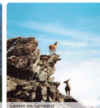
Gamsen am Gornergrat