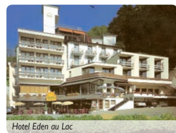
Hotel Eden au Lac

Von seiner Terrasse genießen Sie einen herrlichen Blick auf Urnersee und Promenade. Ein Aufzug führt in die einzelnen Etagen. Die Zimmer sind mit Bad bzw. Dusche und WC sowie Fernseher ausgestattet. Im Restaurant, dem sich ein Wintergarten mit tollem Seeblick anschließt, bedienen Sie sich am reichhaltigen Frühstücksbuffet. Ein „Hingucker“ ist auch der Felsenkeller. Das Abendessen nehmen Sie im Restaurant des benachbarten Hotel Elite ein. Unsere SKAN-CLUB 60 plus-Betreuung führt Sie durch sehr interessante Tage.