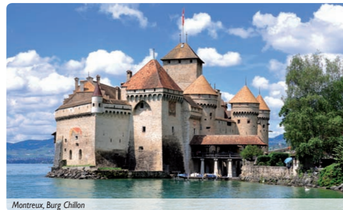
Montreux, Burg Chillon