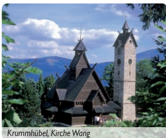
Krummhübel, Kirche Wang