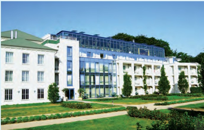
MARITIM Hotel „Kaiserhof“

Es gilt als das mondänste Seebad der Insel. Balkone und Veranden, Rundbögen, Treppchen und Säulen, überwiegend mit Jugendstilornamenten und in weißer Grundfarbe, rufen immer wieder ein Entzücken hervor. In Heringsdorf treffen Sie auch auf die längste Seebrücke Deutschlands. Es ist faszinierend, über den Wellen der Ostsee vom Brückenrestaurant bei einer Tasse Kaffee auf Heringsdorf zu schauen. Die „gute alte Zeit“ spiegelt sich ebenso in den Straßen des Ostseebades wider. Wo vor über hundert Jahren das Heringsdorfer Strandcasino gebaut wurde, steht jetzt die Spielbank. Sie und der Kursaal mit Tagungsbereich und modernster Technik sind dem