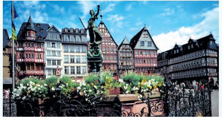
auch das ist Frankfurt am Main