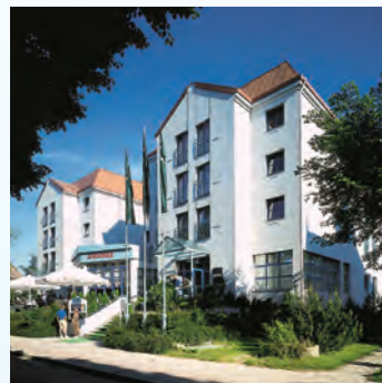
MORADA Hotel Arensee