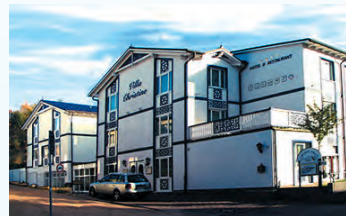
Hotel „Villa Christine“