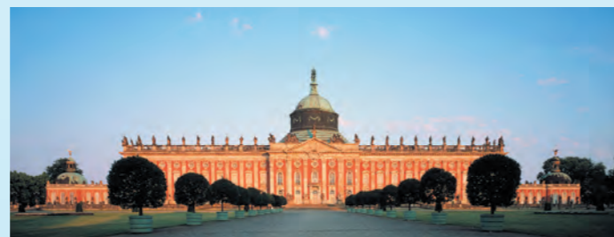
Potsdam, Sanssouci, Neues Palais

(Das „All inclusive-Angebot“ erhalten Sie ausschließlich im Restaurant/Wintergarten und gilt nicht während des Weihnachts-, Silvester- und Osterdurchganges .)