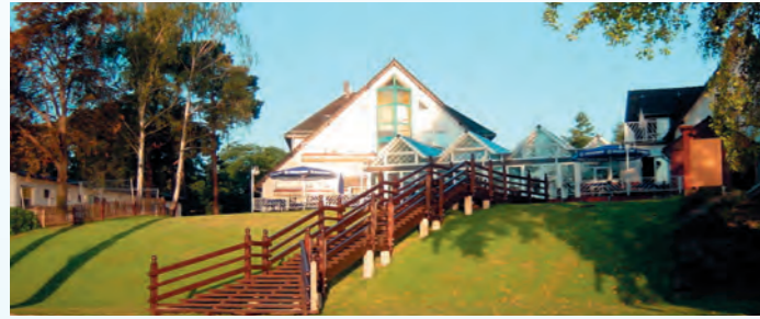
MORADA Hotel Am Mellensee