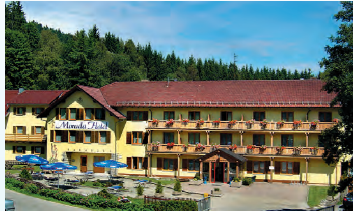
MORADA Hotel Bischofsmais

... mit „All inclusive-Angebot“! Mit großem Wellness- und Freizeitbereich!