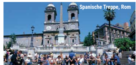
Spanische Treppe, Rom