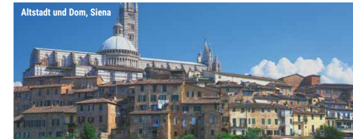
Altstadt und Dom, Siena