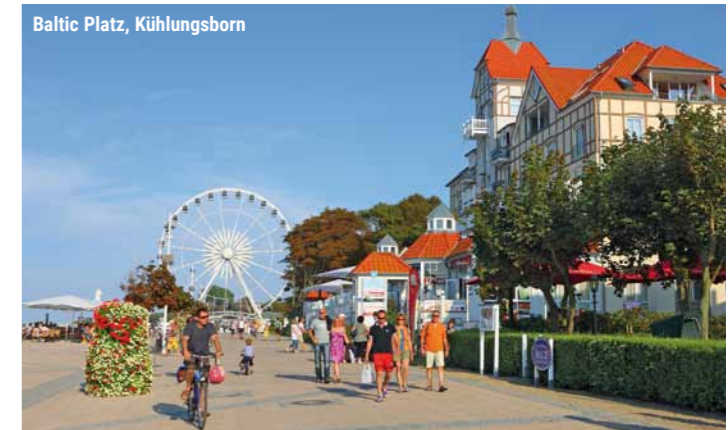
Baltic Platz, Kühlungsborn

Kein Einzelzimmerzuschlag! (begrenzte Anzahl)