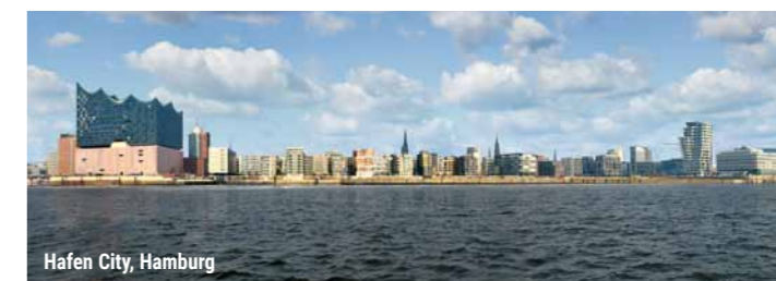
Hafen City, Hamburg