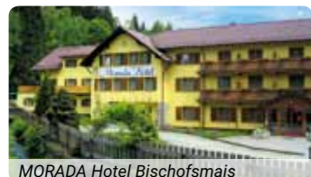
MORADA Hotel Bischofsmais

führen Aufzüge in die drei Etagen des individuell gestalteten Hotels. Die geräumigen Zimmer sind mit Bad bzw. Dusche, WC, Flachbildfernseher sowie größtenteils mit Telefon, Balkon bzw. Terrasse ausgestattet. Freude bereitet es, im attraktiv gestalteten Restaurantbereich die Speisen einzunehmen, in der Festhalle zu feiern und im Hallenbad seine Bahnen zu ziehen. Ihr SKAN-CLUB 60 plus-Urlaubshotel steht, für Wanderungen durch die unverfälschte Landschaft ideal, am waldreichen Saum von Bischofsmais, unweit des Hausbergs, des 1.097 Meter hohen Geißkopf. Erfahren Sie die stille Kraft der Natur! Das wohlthuende Höhenklima, unvergleichliche Panoramen und unsere SKAN-CLUB 60 plus-Betreuung werden Ihnen stete Wegbegleiter sein.