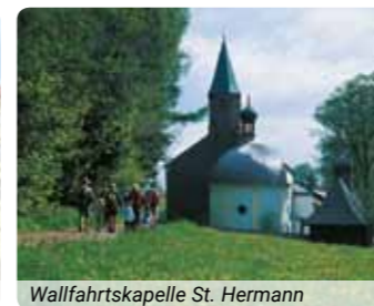
Wallfahrtskapelle St. Hermann