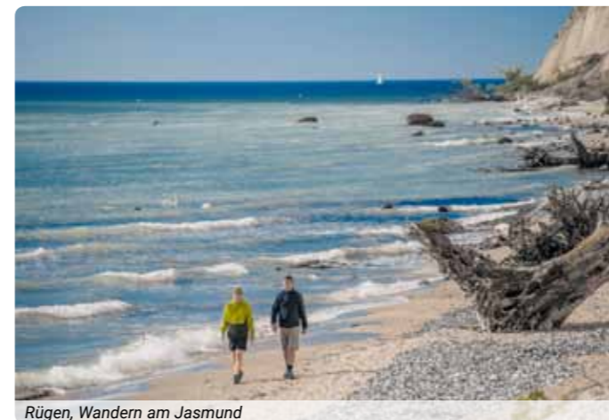
Rügen, Wandern am Jasmund