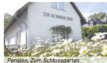
Pension, Zum Schlossgarten

Ihr Aufenthalt hier bedeutet Entspannung der anderen Art. Vor zwanzig Jahren wurde das ruhig gelegene Ferienareal erbaut. In der gepflegten Gartenanlage mit Haupthaus und Ferienhäusern werden Sie die übliche Hotelatmosphäre nicht vermissen. Das zentrale Gebäude beherbergt ein behagliches Restaurant sowie eine Bowlingbahn. Hell und freundlich sind die Gästezimmer gestaltet und mit Bad bzw. Dusche, WC und Föhn, Fernseher und Telefon zweckmäßig ausgestattet. In diesem erholsamen Umfeld werden Sie sich ausgesprochen wohlfühlen und unsere SKAN-CLUB 60 plus-Betreuung hat viele Tipps für ein abwechslungsreiches Freizeitvergnügen für Sie parat.